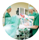
Service des urgences