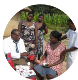
Org. humanitaire / Région isolée

Un dysfonctionnement vasculaire se manifeste de différentes façons et peut être le signe précurseur de problèmes susceptibles de survenir. Une microalbuminurie peut être le marqueur d'un dysfonctionnement vasculaire et nos analyseurs permettent de la détecter à un stade précoce.