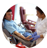
Banque du sang